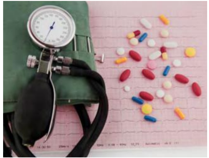
16 Die wichtigsten Blutdrucksenker