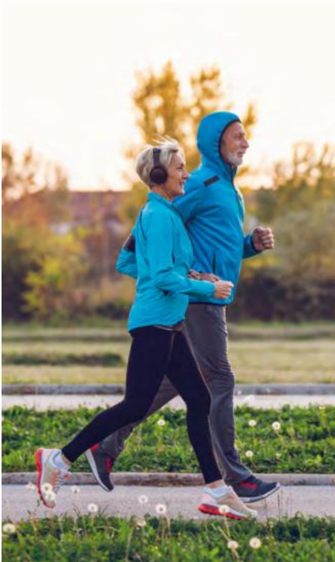
So leben Sie gesund!