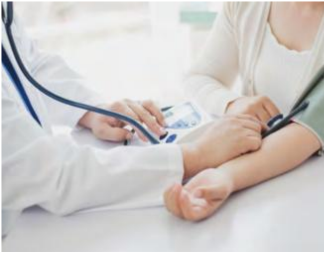
Der Druck muss stimmen