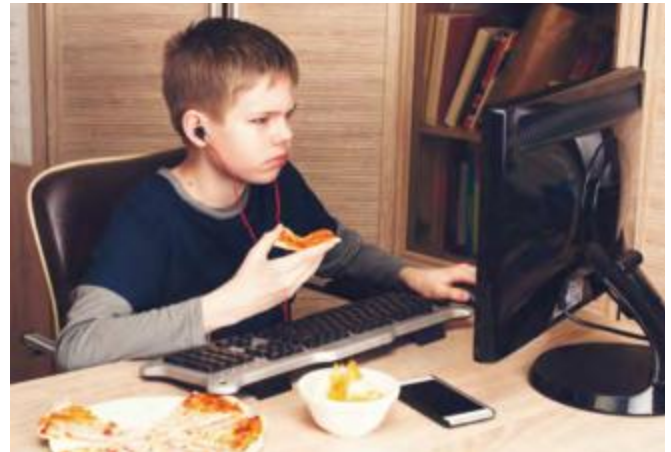
Kinder vor Risikofaktoren schützen